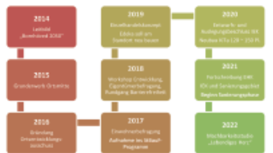
Abb. 2: Bisher erfolgte Schritte im Rahmen der Städtebauförderung für Bornhöved

Abbildung 2 zeigt eine Übersicht der bisher erfolgten Schritte im Rahmen der Städtebauförderung.