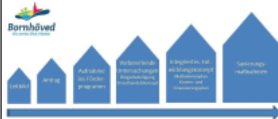
Abb.1: Stationen der Städtebauförderung

Seither hat sich viel getan, auch wenn es im Ortsbild noch nicht sichtbar ist. Denn von der Idee bis zur Umsetzung müssen diese Stationen durchlaufen werden (Abb. 1):