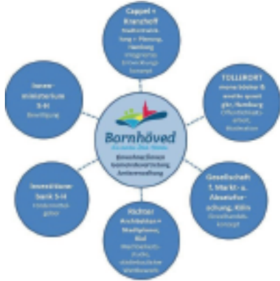
Abb. 3: Akteure der Städtebauförderung

Der Entwurf des Integrierten Entwicklungskonzeptes (IEK) wurde im Juni 2020 wegen der Pandemie auf elektronischem Wege und per Video-Präsentation öffentlich kommuniziert, um Einwände und Anregungen von Einwohnerinnen und Einwohnern sowie der Träger öffentlicher Belange (u.a. Nachbargemeinden, Verbände, Behörden, Kirche) zu berücksichtigen.