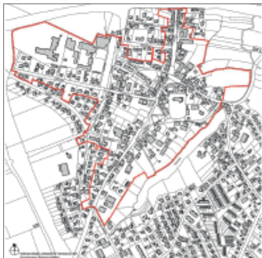
Abb. 4: Sanierungsgebiet Bornhöved (IEK, cappel+kranzhoff stadtentwicklung und planung)

Im Juni 2021 konnte die Gemeindevertretung das aktualisierte Einzelhandelskonzeptes in der Fassung der Teilfortschreibung vom 15.04.2021 beschließen.