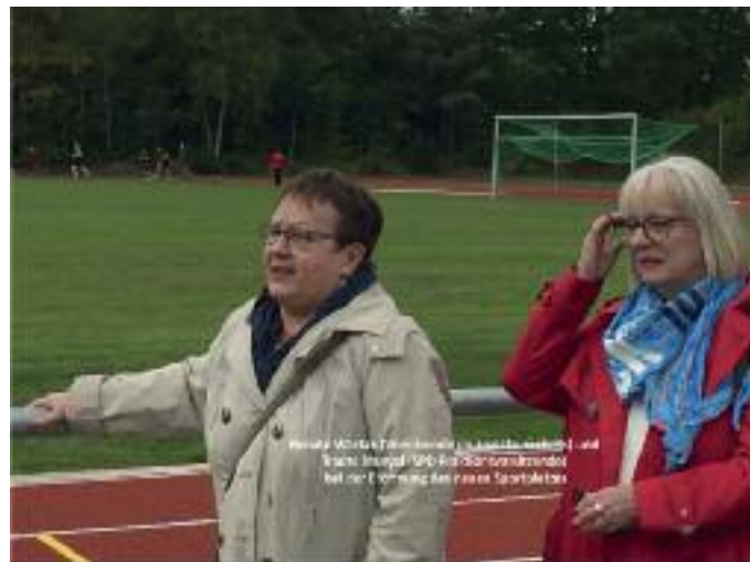
Liebe Mitbürgerinnen und Mitbürger,

in regelmäßigen Abständen von ca. 3 Monaten berichten wir über die Aktivitäten, Beschlüsse und Vorhaben der SPD Fraktion in der Gemeinde Trappenkamp. Nachdem die Corona-Pandemie uns im 2. Quartal dieses Jahres „ausgebremst“ hat, können und wollen wir nun wieder berichten. Aber wir bitten Sie eindringlich : Seien Sie weiterhin wachsam, halten sie sich an die „AHA“-Regeln und bleiben Sie vor allem gesund!