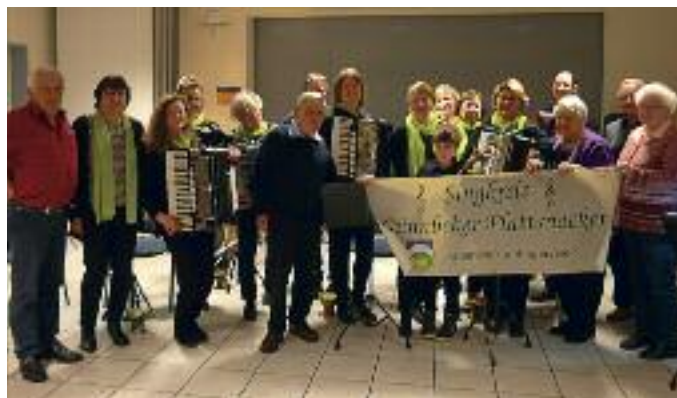
Mit einem Ständchen überraschte das Akkordeonorchester Trappenkamp den Singkreis der Günnebeker Plattsnacker.